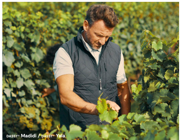
DASSY® Madidi / DASSY® Yala

Zertifizierung: EN 343:2019 klasse 4-4-X