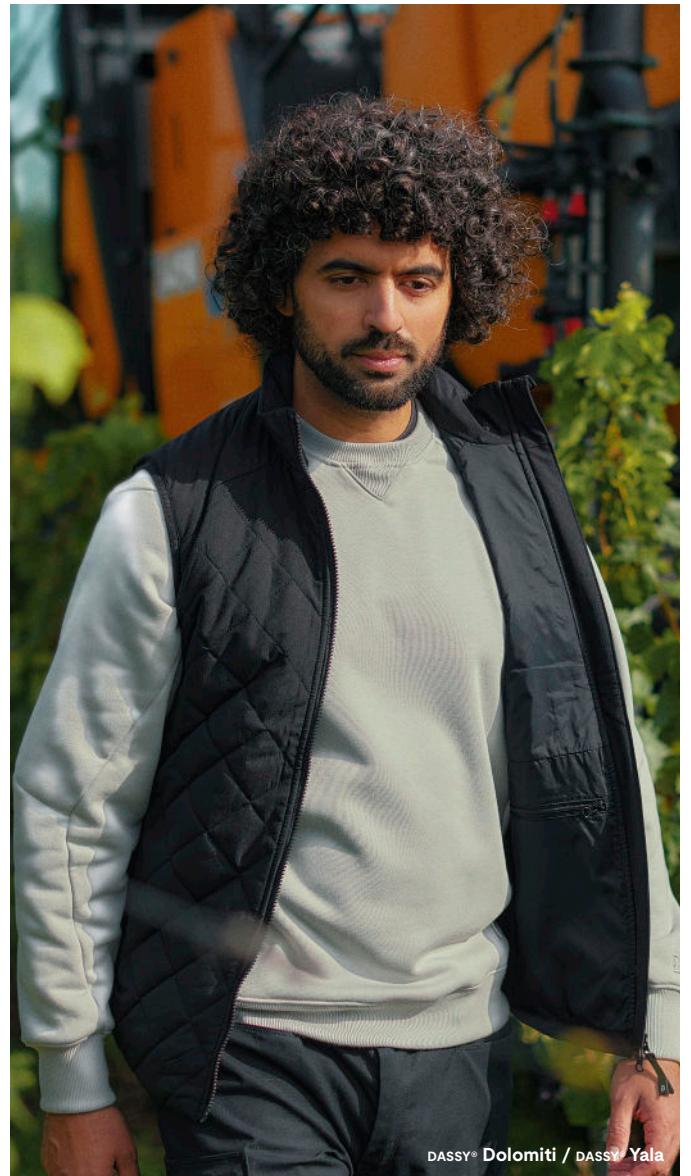
DASSY® Dolomiti / DASSY® Yala

Tragen Sie die Arbeitshose DASSY® Jasper mit unseren zertifizierten Kniepolstern Fide zu tragen. Für optimal geschützte Knie.