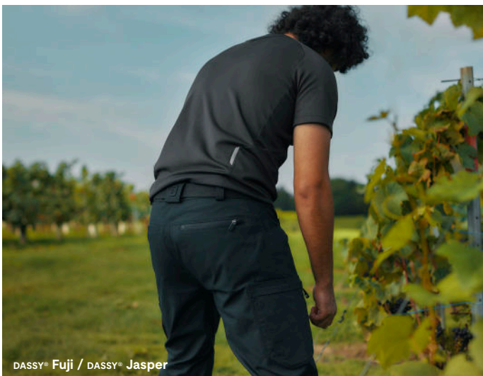
DASSY® Fuji / DASSY® Jasper